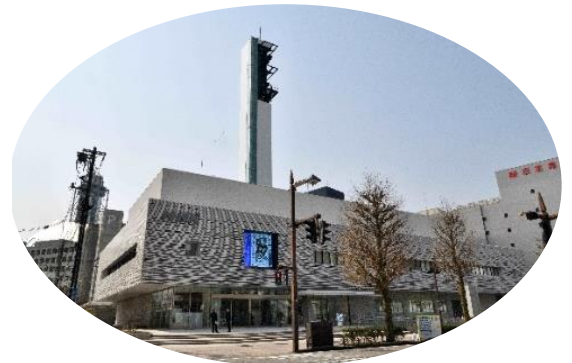
富山県水墨美術館