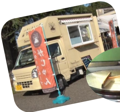
クレープ かじゅん