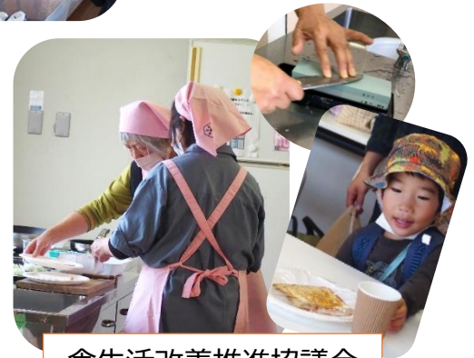
食生活改善推進協議会