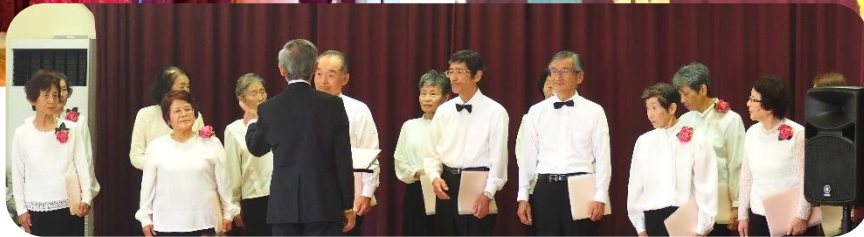
美しい音色と歌声♪