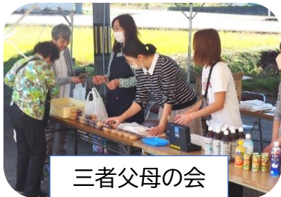
三者父母の会 スポーツフェス