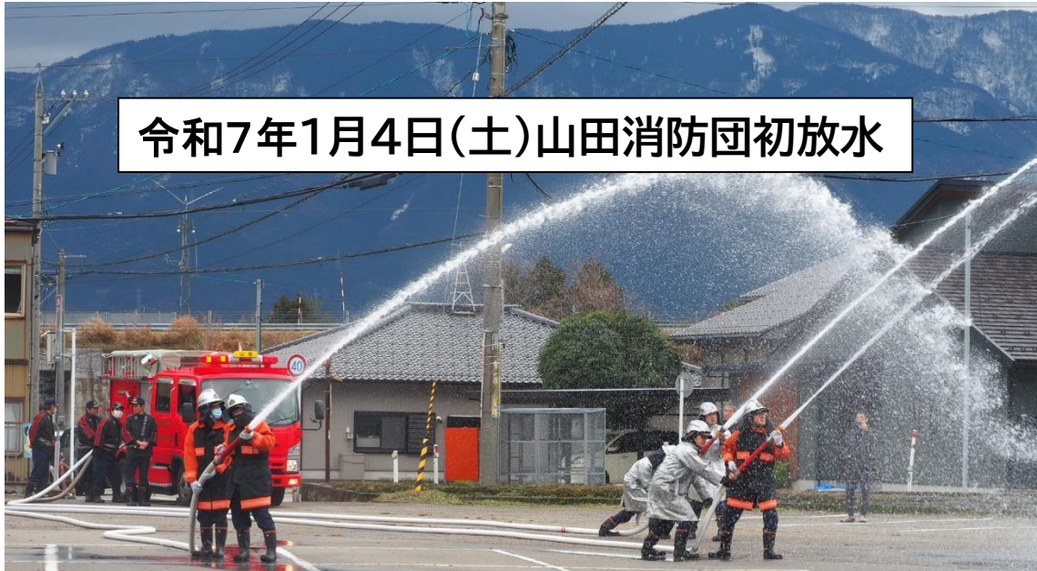
令和7年1月4日(土)山田消防団初放水