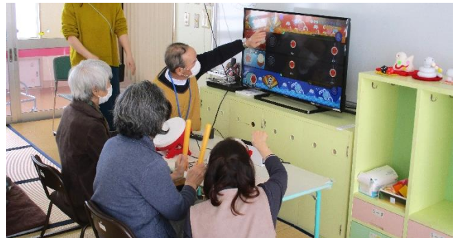
eスポーツ「太鼓の達人」にも挑戦