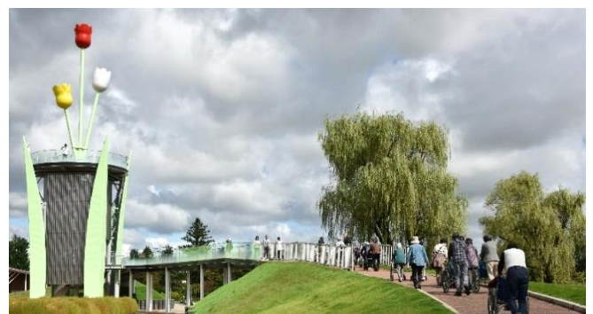
バス遠足で「砺波チューリップ公園」を散策