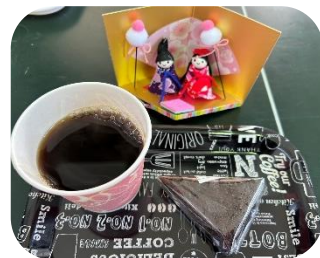
NOSE ART GAREGE fukumitsu(森松和菓子) 窪田農産