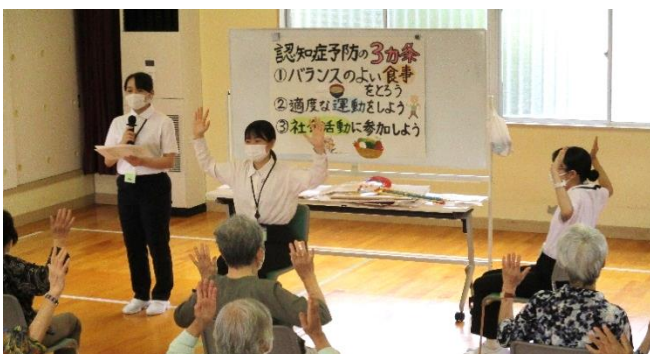
富山大学看護学生による「フレイル予防」