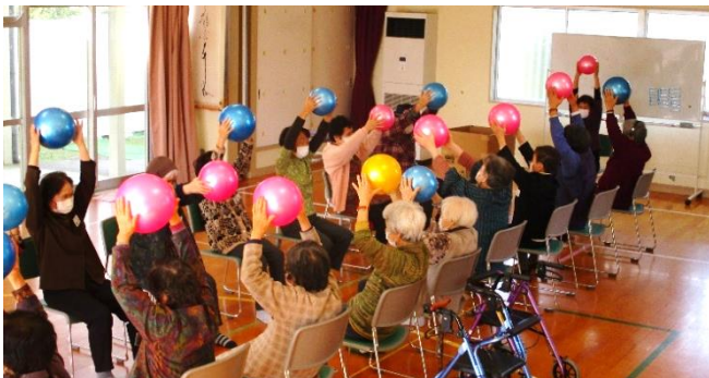
介護予防の体操やレクリエーション